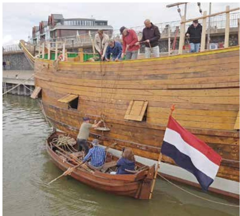
Laden van loodbroodje

De andere 58 broodjes kwamen later per vrachtwagen. Op de dag van het plaatsen van de masten werden deze aan boord gehesen. Het eeuwenoude lood van Kaap Skil met een gewicht van een kleine 6000 kilo moet de Witte Swaen stabiliteit geven. Dit tezamen met de 15000 kilo aan loodstaven die al eerder, op 21 juni, waren geladen. Deze strakke, 'moderne' staven zijn in het ruim tot een loden vloer aaneengelegd.